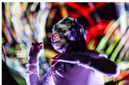
Making of Björk Digital