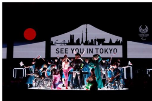
リオ2016パラリンピック競技大会閉会式 東京2020フラッグハンドオーバーセレモニー