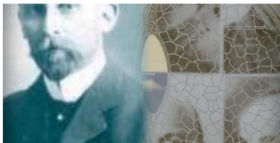
Brian Eno's The Ship-A Generative Film © Opal Limited 2016