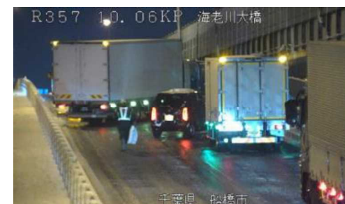
国道357号 路面凍結によるスリップ事故 <令和4年1月7日>