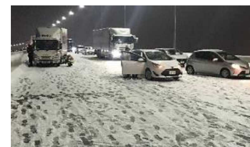
首都高速中央環状線の立ち往生発生状況 <令和4年1月6日>

○このほか、主要な国道においても冬タイヤやチェーン未装着車によるスリップ事故が多発しました。