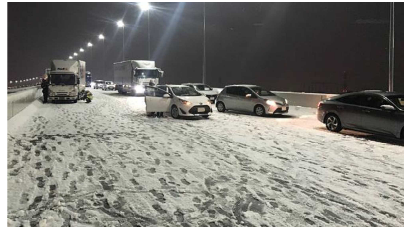
車両の滞留 ＜首都高速道路 中央環状線＞