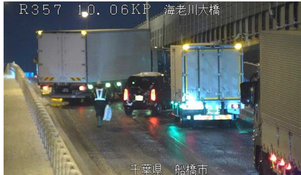
冬タイヤやチェーン未装着車両によるスリップ事故 ＜国道357号＞