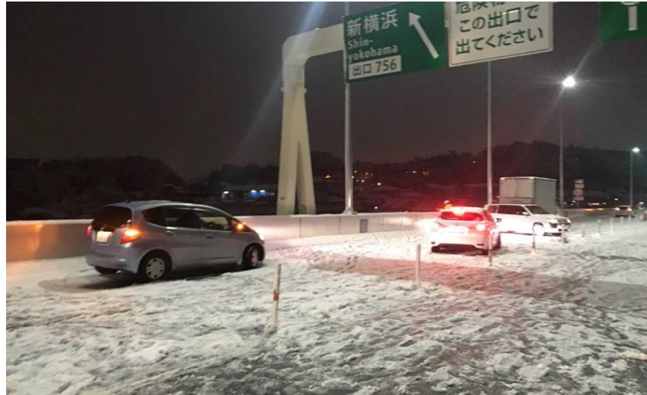
冬タイヤやチェーン未装着車両による立ち往生 ＜首都高速道路 横浜北線＞