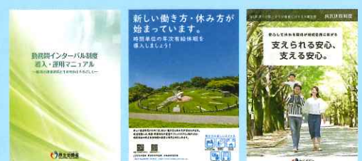
各制度に関するリーフレット(例)

「勤務間インターバル制度」「時間単位の年次有給休暇制度」「特別な休暇制度」などについて、企業の取組事例の紹介や、リーフレットなどの資料を掲載しています。自社における制度検討の参考にご活用ください。