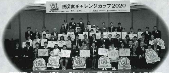
脱炭素チャレンジカップ2020の様子(2020年2月開催)